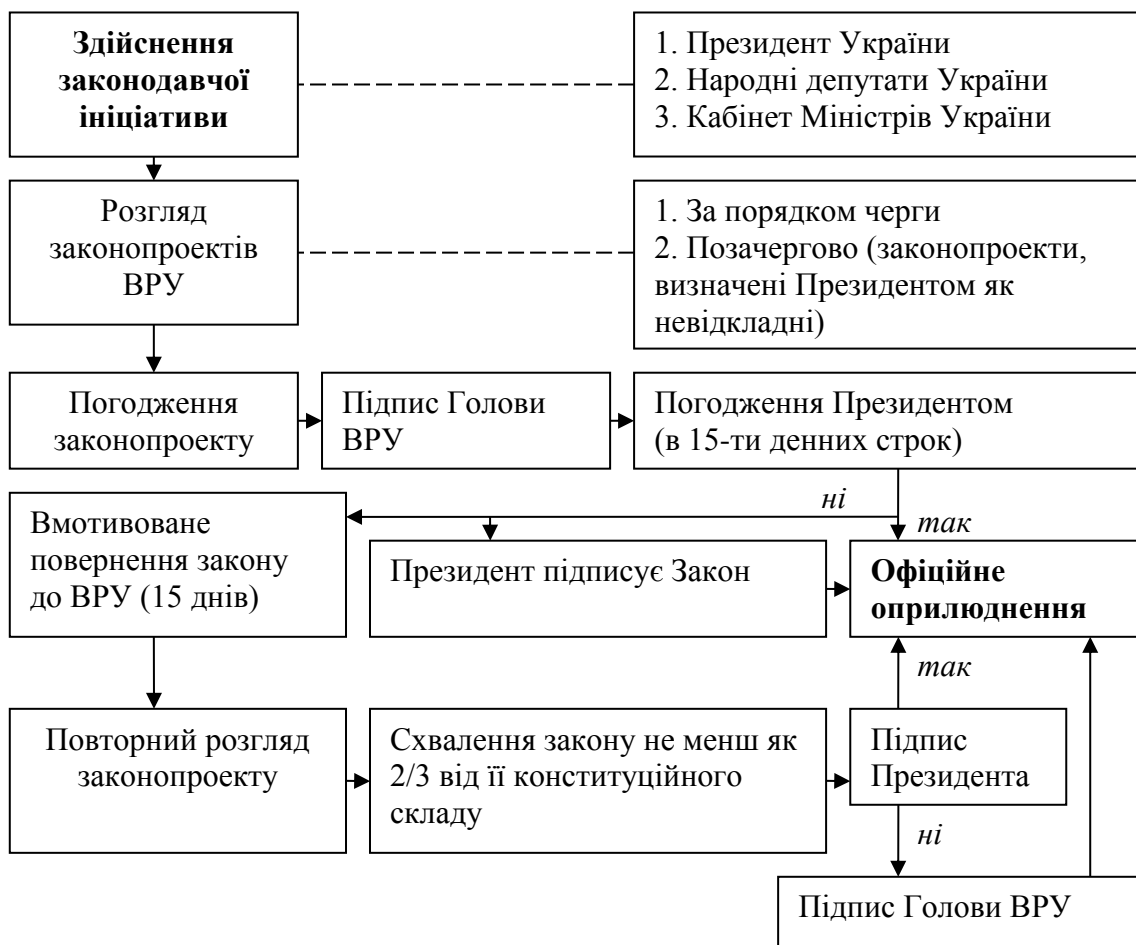
Рис. 2.2 Логічна схема реалізація прав законодавчої ініціативи

законодавчої ініціативи у Верховній Раді України належить Президентові України, народним депутатам України та Кабінету Міністрів України. Законопроекти, визначені Президентом України як невідкладні, розглядаються Верховною Радою України позачергово (рис. 2.2). Закон підписує Голова Верховної Ради України і невідкладно направляє його Президентові України. Президент України протягом п'ятнадцяти днів після отримання закону підписує його, беручи до виконання, та офіційно оприлюднює його або повертає закон зі своїми вмотивованими і сформульованими пропозиціями до Верховної Ради України для повторного розгляду. У разі якщо Президент України протягом встановленого строку не повернув закон для повторного розгляду, закон вважається схваленим Президентом України і має бути підписаний та офіційно оприлюднений. Якщо під час повторного розгляду закон буде знову прийнятий Верховною Радою України не менш як двома третинами від її конституційного складу, Президент України зобов'язаний його підписати та офіційно оприлюднити протягом десяти днів. У разі якщо Президент України не підписав такий закон, він невідкладно офіційно оприлюднюється Головою Верховної Ради України і опубліковується за його підписом. Закон набирає чинності через десять днів з дня його офіційного оприлюднення, якщо інше не передбачено самим законом, але не раніше дня його опублікування.